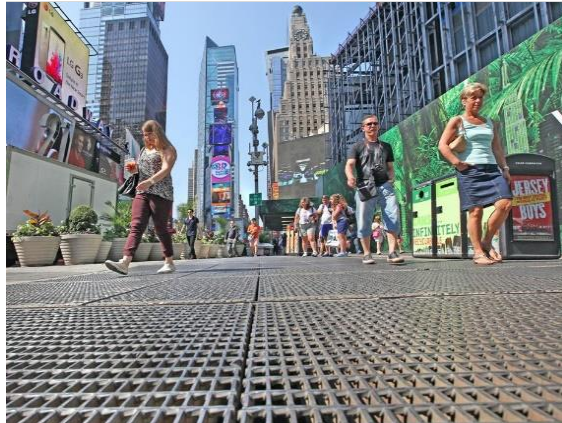
"Times Square" de Max Neuhaus en la calle 46, encima de la estación Times Sq-42St. Créditos: Rober Wilson (MTA, 2021).

El presente ensayo analiza una instalación sonora contemporánea -permanente- en un espacio público y su impacto en el campo artístico internacional. Para ello nos valemos del corpus teórico del arte contemporáneo y del arte sonoro en particular. ¿Qué hace de esta pieza sonora una obra de arte contemporáneo y cómo responde al nuevo paradigma?