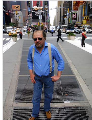
Max Neuhaus (2002) en "Times Square".

porque es producida deliberadamente con medios electrónicos y digitales, para intervenir un espacio público (la concurrida esquina de la calle 45 con la calle 46 en New York), utilizando un ducto de ventilación de Metro que funciona como caja de resonancia del sonido, que sale del subsuelo verticalmente y que sufre imprevistas variaciones (en cada todo momento y en cada instante) producto de las interacción vibratoria con las corrientes de aire del ducto, para finalmente integrarse al bullicio de la calle.