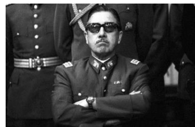
Augusto Pinochet [1915 - 2006] Dictador de Chile

|||. A finales de siglo XX, Margaret Thatcher, quien fuera primera ministra de Gran Bretaña durante el conflicto de Las Malvinas de 1982, pronunció un discurso el 6 de octubre de 1999 en la conferencia del Partido Conservador británico, en el contexto del debate por el arresto de Pinochet en Londres. Thatcher reconoció en Chile al más antiguo y cercano amigo de Gran Bretaña en Sudamérica, amistad que se remonta – precisó- desde la época de la lucha por la independencia de Chile (aludiendo al almirante Cochrane). La fidelidad de Chile –añadió- se demostró durante la guerra de las Malvinas, proporcionando alertas informativas sobre el movimiento de ataques aéreos argentinos, a partir de reportes de radares de largo alcance. Gran Bretaña tiene -dijo Thatcher- una gran deuda con Chile. Finalmente, indicó que el arresto de Pinochet podría ocasionar serias complicaciones para los intereses británicos, no sólo en las Malvinas y en América del Sur, sino con sus demás aliados en sus enclaves alrededor del mundo: