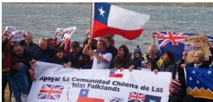
Febrero 2012 - chilenos residentes en Las Malvinas mostrando su apoyo a Inglaterra

En conclusión, hoy como ayer y tras dos siglos (1811-2012) la clase dominante chilena y su política de alianzas con los imperios sigue confrontada con la visión integracionista del pueblo sudamericano.