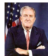
Walter Vernon (CIA)

Por otro lado, según un documento secreto del Departamento de Estado norteamericano (hoy desclasificado) sobre la conversación sostenida entre el dictador chileno Augusto Pinochet y el embajador Walter Vernon (militar, diplomático y ex director adjunto de la CIA), realizada el 13 de mayo de 1982 (durante la Guerra de Las Malvinas); Pinochet aseguró que Chile no trataría de tomar ventaja de los problemas de Argentina. Además añadió que dudaba de una posible solución hasta que los argentinos no recibieran una lección.