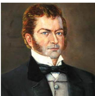
Bernardo O'higgins [1778 - 1842] Director Supremo de Chile

“... uno de mis primeros cuidados al recibirme de la Suprema Dirección de Chile fue tributar a V.A.R el homenaje de mi respeto como debido a quien tiene la gloria de presidir al Pueblo más libre y poderoso del Globo... El feliz éxito que ha coronado los esfuerzos de V.A.R. por la pacificación de Europa correspondería sin duda a su intervención poderosa por la felicidad del Nuevo Mundo, y cuando al otro influjo de V.A.R. debiese Chile la recuperación de sus derechos, cuando los buques de los súbditos de Inglaterra visitasen libremente nuestros puertos, y cuando al abrigo de una constitución liberal pueda ofrecer el oro desentrañado de las montañas de este país en cambio de la industria de sus laboriosos vasallos entonces me lisongeo.”