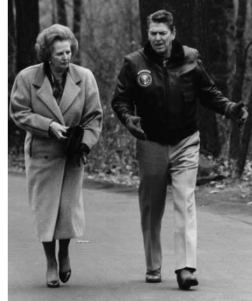
Thatcher y Reagan en Camp David