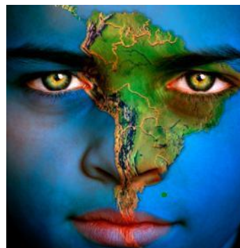
Una Perspectiva Sudamericana

De tal suerte, que la descolonización de las islas del Atlántico Sur y de los territorios de la Antártida sudamericana tiene tres escenarios de acción política y diplomática: al interior de Chile, en el marco de UNASUR y en el concierto de la Organización de Naciones Unidas.