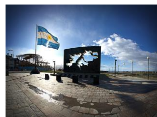
Malvinas Argentinas Sudamericanas