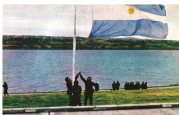
Malvinas Argentinas 1982