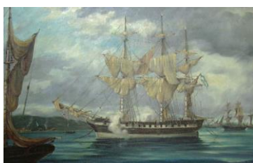
Malvinas Argentinas 1820

De tal suerte, que la descolonización de las islas del Atlántico Sur y de los territorios de la Antártida sudamericana tiene tres escenarios de acción política y diplomática: al interior de Chile, en el marco de UNASUR y en el concierto de la Organización de Naciones Unidas.